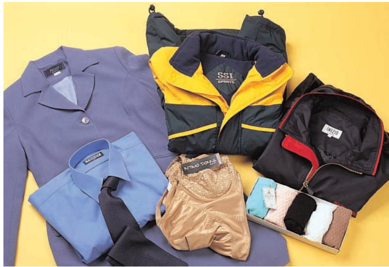
이번에 시험한 33개 제품 중 신체형 개선팬티(BC카드)·올인원 2종 세트(BC카드)·코오롱 험업트레이닝복(BC카드)·SSI 레져사파리(국민카드)·와이셔츠넥타이세트(삼성카드)·넛시매직양상블(39소핑) 6종은 아무 이상이 없었다.