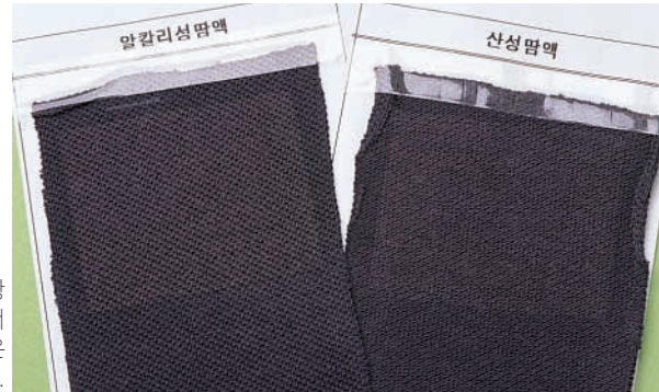
→ 땀·일광 복합 견뢰도에서 문제가 된 제품은 티셔츠 3종.