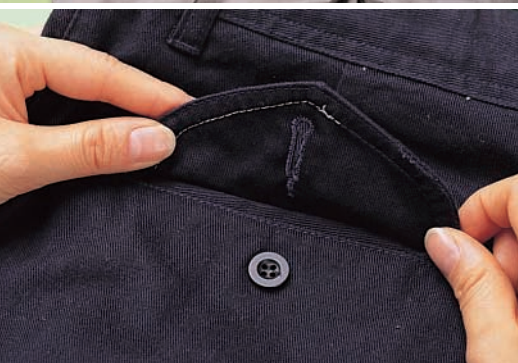
← 뒷주머니 봉제 부분의 실 색깔이 다르게 바느질 된 바지.