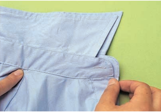
← 좌우의 형태가 일치해야 하는데 어긋나 문제가 된 셔츠.