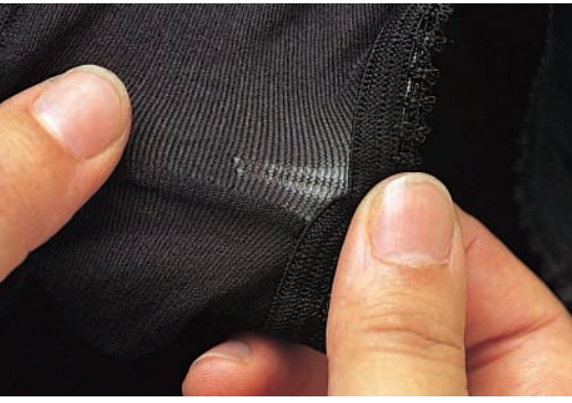
← 외관상 중요한 결점에 해당하는 코빠짐이 생긴 스타킹.