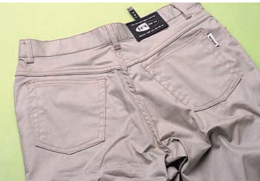
← 허리 밴드에 주름이 생겨 보기 흉한 여성용 바지.