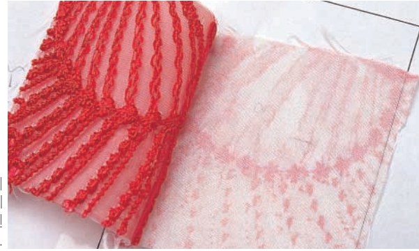
→ 염색 물이 빠지지 않아야 하는데 심하게 물이 빠진 팬티.