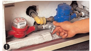
1 지수관을 잠근다.